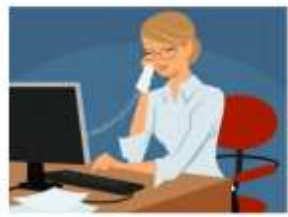
Консультационный пункт организуется консультационными специалистами

Если вы хотите проконсультироваться с нашими специалистами ↓ Предварительная запись по телефону с 13:00-15:00 Контактный телефон 31-5-98 или 31-5-56