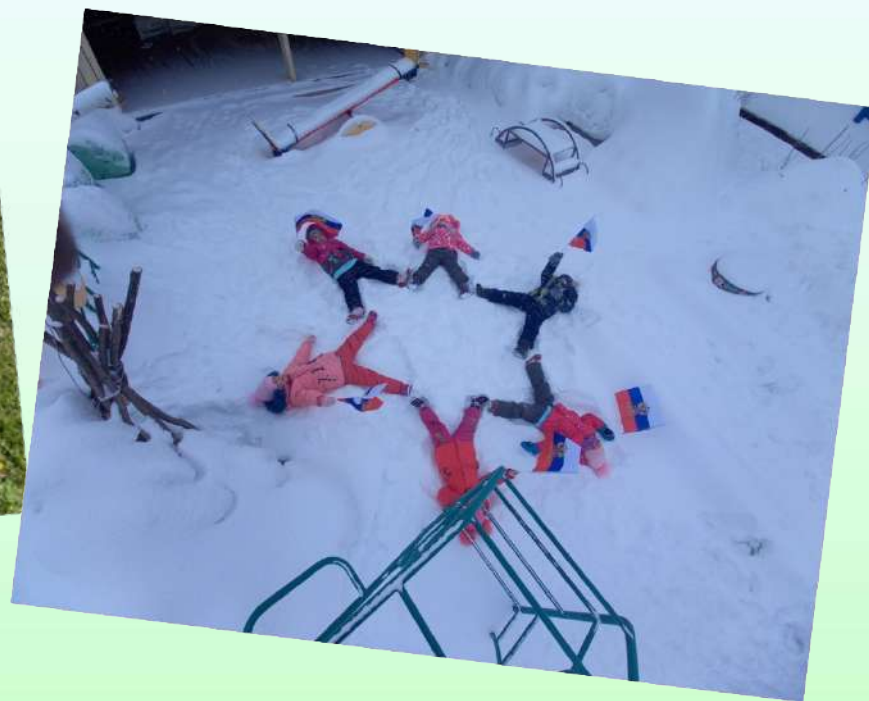
Флэш-моб «Звезда». Поздравляем всех Защитников Отечества!