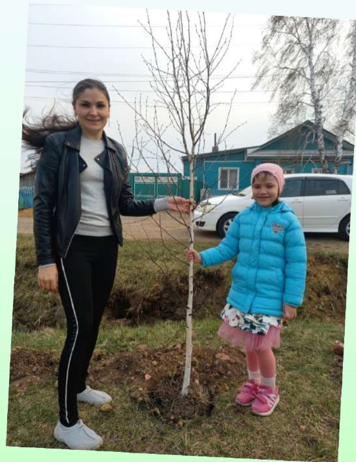
Социальная акция «Аллея славы»