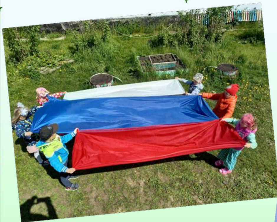
Флэш-моб «Мы – россияне».