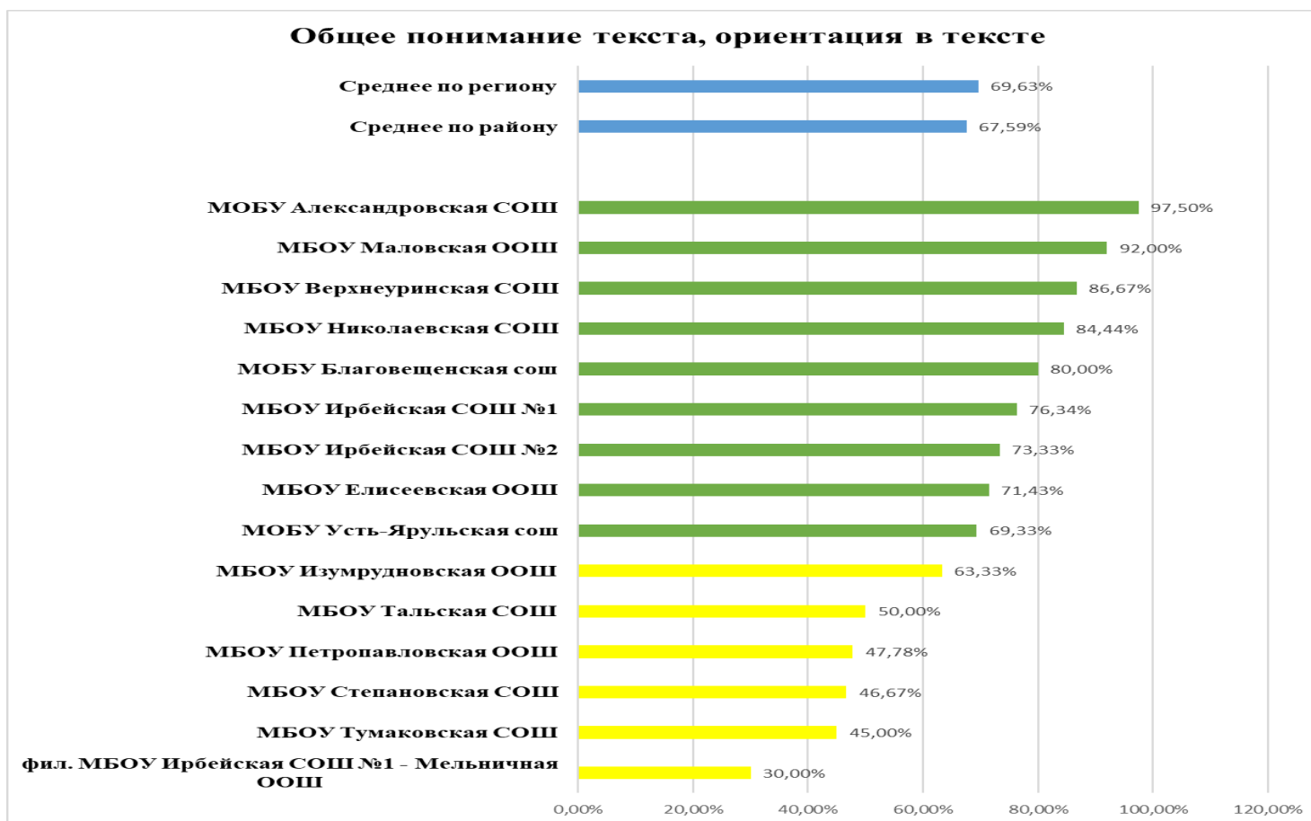
Диаграмма 1.2. КДР 4 ЧГ 2022: Успешность выполнения заданий по группам умений

Ниже среднего значения по региону (69,63%): МБОУ Изумрудновская ООШ, МБОУ Тальская СОШ, МБОУ Петропавловская ООШ, МБОУ Степановская СОШ, МБОУ Тумаковская СОШ, фил. МБОУ Ирбейская СОШ №1 - Мельничная ООШ.