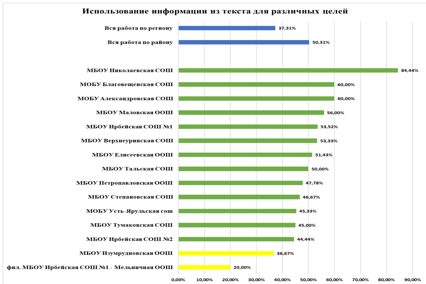
Диаграмма 1.4. КДР 4 ЧГ 2022: Успешность выполнения заданий по группам умений

Ниже среднего значения по региону (37,31%): всего 2 школы МБОУ Изумрудновская ООШ, фил. МБОУ Ирбейская СОШ №1 - Мельничная ООШ.